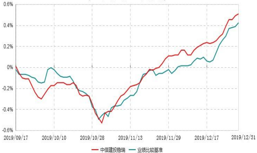
中信建投稳瑞定期开放债券型证券投资基金累计净值增长率与业绩比较基准收益率历史走势对比图 (2019年09月17日-2019年12月31日)