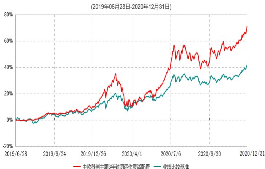
中欧科创主题3年封闭运作灵活配置混合型证券投资基金累计净值增长率与业绩比较基准收益率历史走势对比图