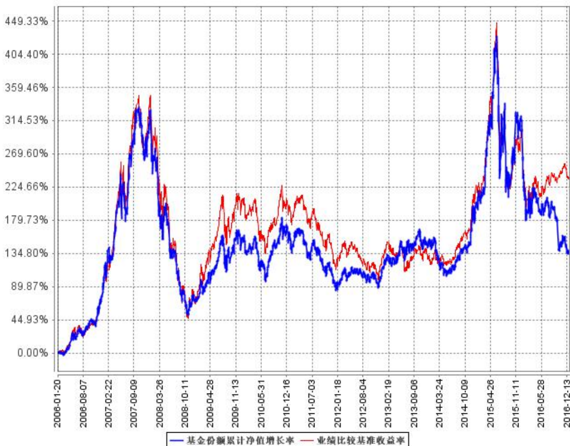
基金份额累计净值增长率与同期业绩比较基准收益率的历史走势对比图