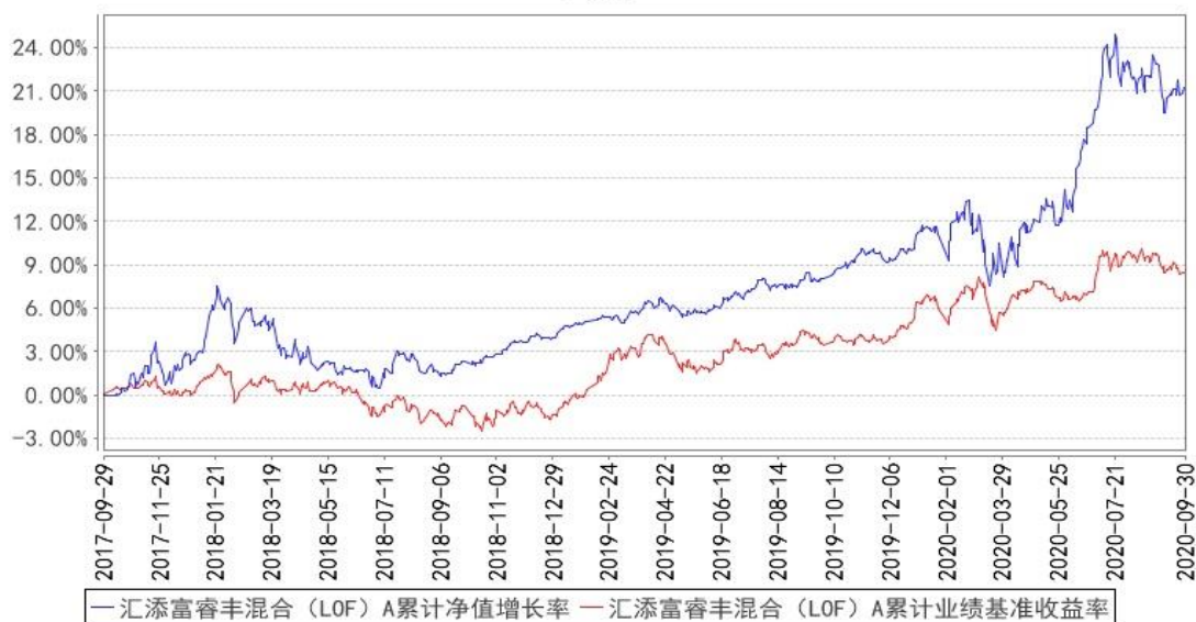
汇添富睿丰混合（LOF）A累计净值增长率与同期业绩比较基准收益率的历史走势对比图