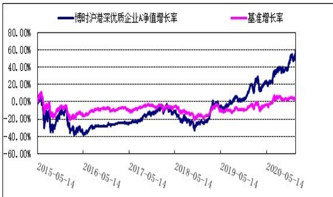
2. 博时沪港深优质企业C: