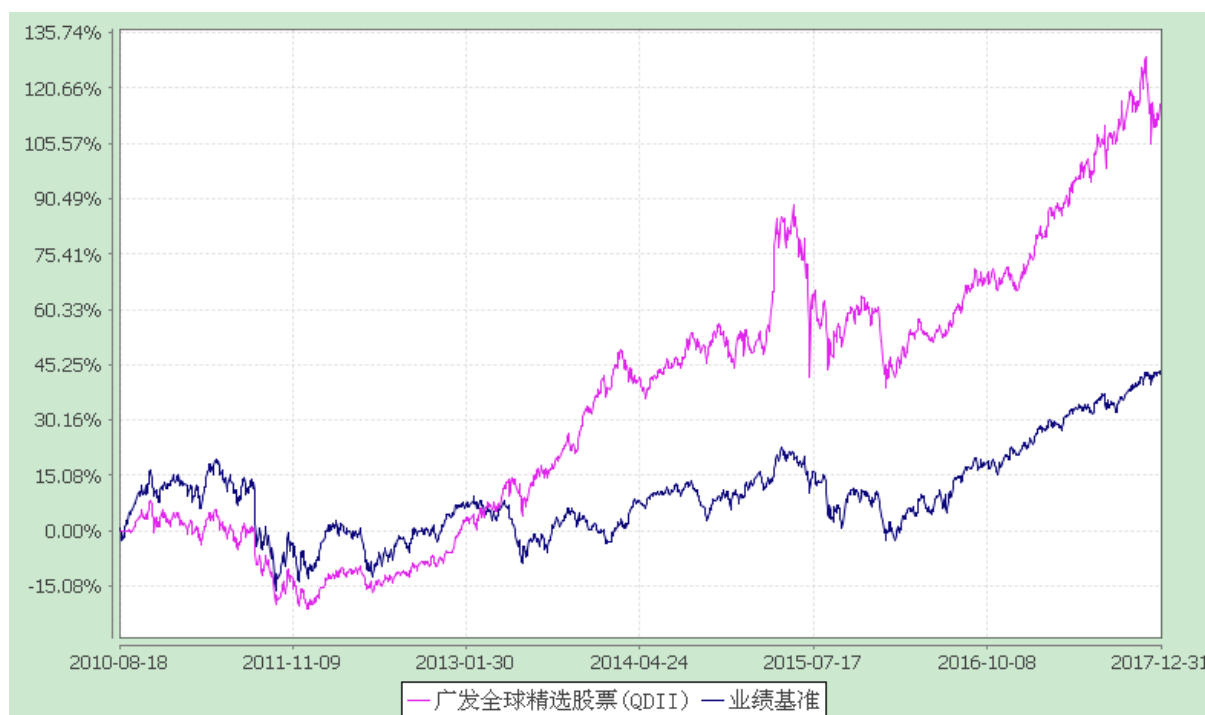
广发全球精选股票型证券投资基金 份额累计净值增长率与业绩比较基准收益率历史走势对比图 (2010 年 8 月 18 日至 2017 年 12 月 31 日)

注：本基金自 2014 年 6 月 10 日起，将基金业绩比较基准由“摩根士丹利综合亚太（除日本）总收益指数”变更为“60%×MSCI 全球指数（MSCI World Index）+40%×恒生指数”。