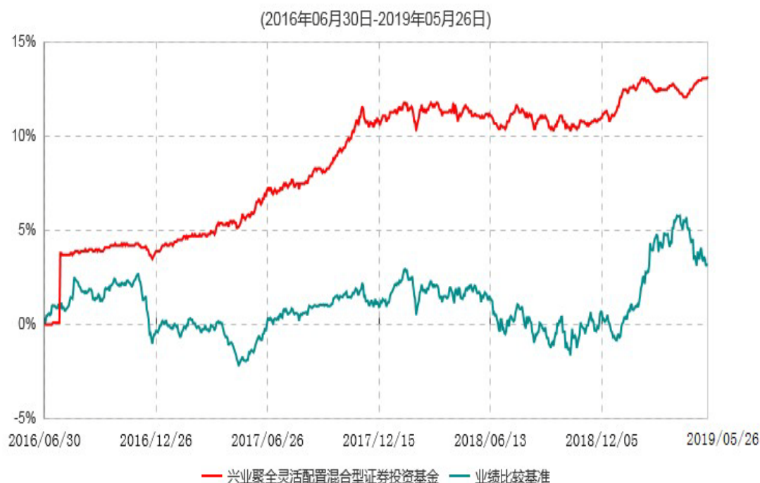
兴业聚全灵活配置混合型证券投资基金累计净值增长率与业绩比较基准收益率历史走势对比图

1、本报告期内，兴业聚全灵活配置混合型证券投资基金自2019年4月30日起至2019年5月26日以通讯方式召开基金份额持有人大会，于2019年5月27日表决通过了《关于兴业