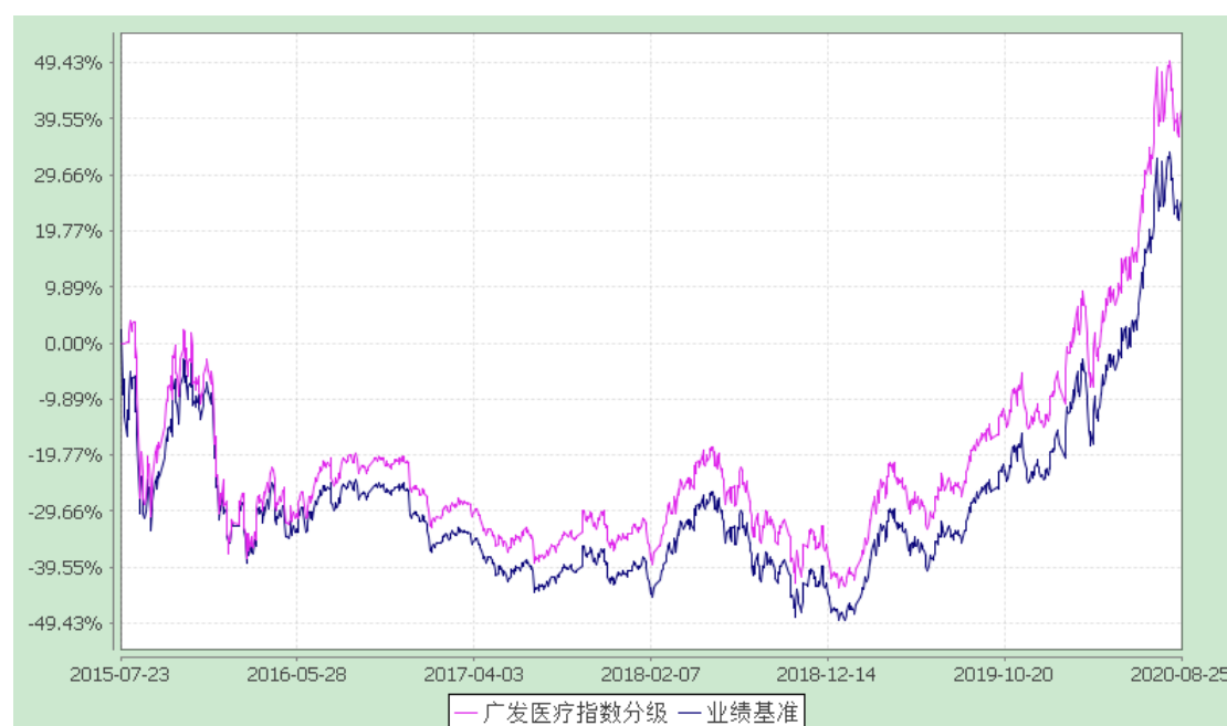
广发中证医疗指数分级证券投资基金 份额累计净值增长率与业绩比较基准收益率历史走势对比图 (2015年7月23日-2020年8月25日)