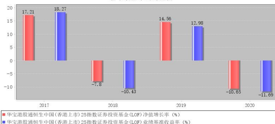
华宝港股通恒生中国（香港上市）25 指数证券投资基金（LOF）每年净值增长率与同期业绩比较基准收益率的对比图