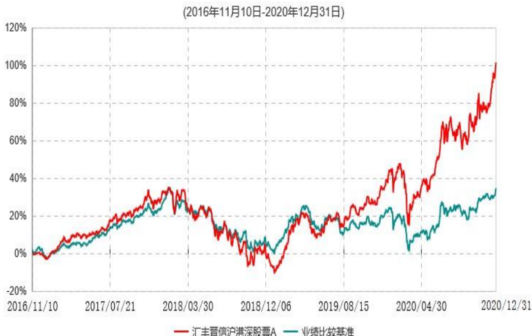
汇丰晋信沪港深股票A累计净值增长率与业绩比较基准收益率历史走势对比图