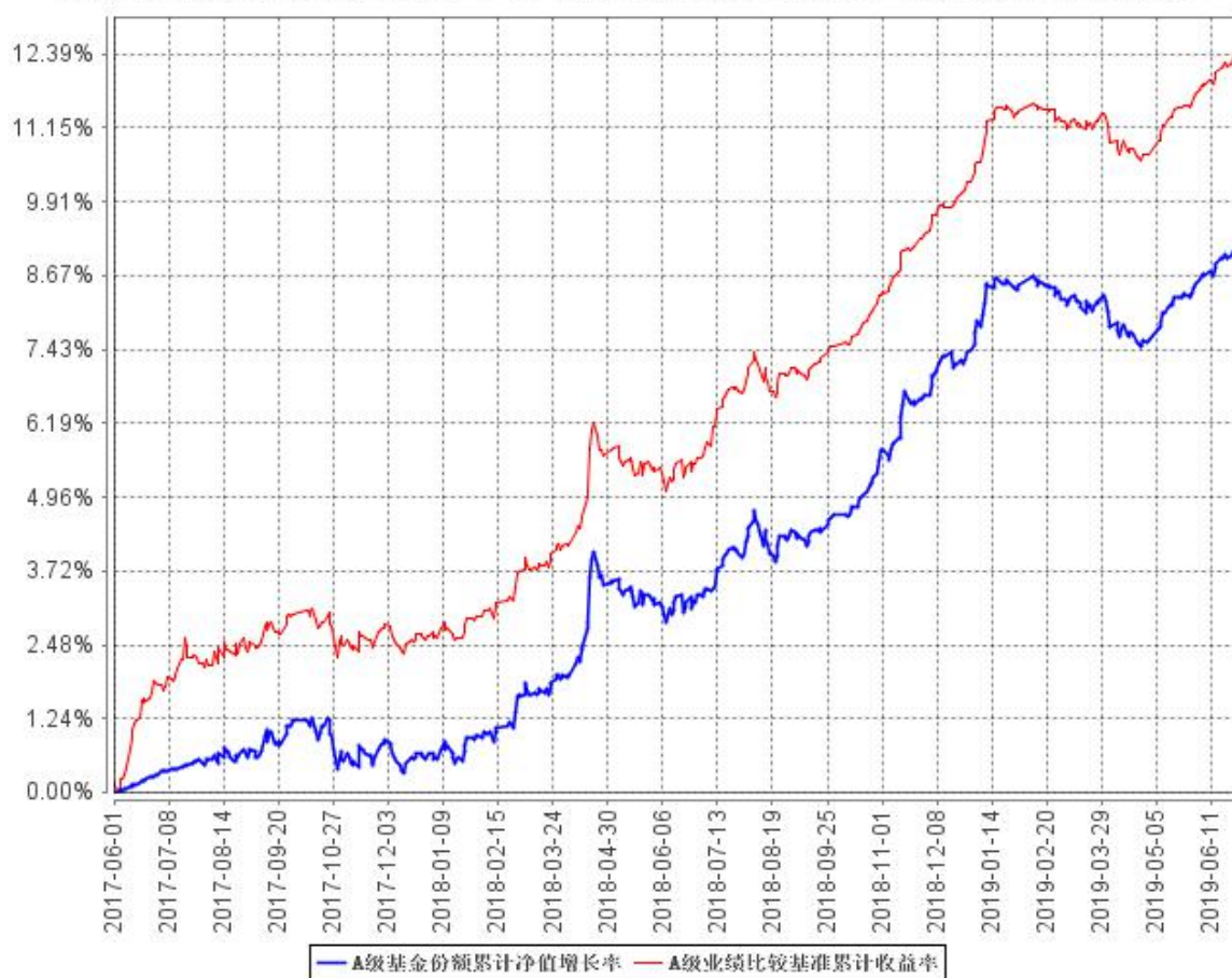
A 级基金份额累计净值增长率与同期业绩比较基准收益率的历史走势对比图