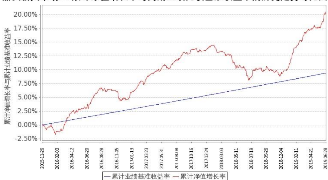
图 2：嘉实新兴市场 C2 份额累计净值增长率与同期业绩比较基准收益率的历史走势对比图 (2015 年 11 月 26 日至 2019 年 6 月 30 日)

注：按基金合同和招募说明书的约定，本基金自基金合同生效日起 6 个月内为建仓期，建仓期结束时本基金的各项投资比例符合基金合同“第十五部分（二）投资范围和（四）投资限制”的有关约定。