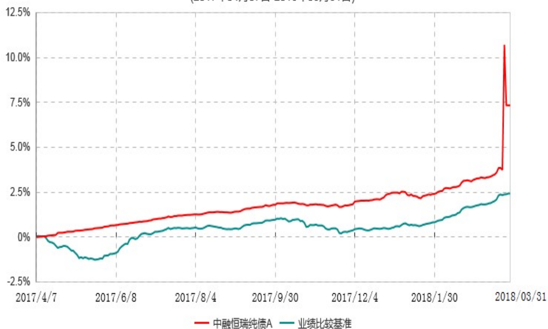
中融恒瑞纯债A累计净值增长率与业绩比较基准收益率历史走势对比图 (2017年04月07日-2018年03月31日)