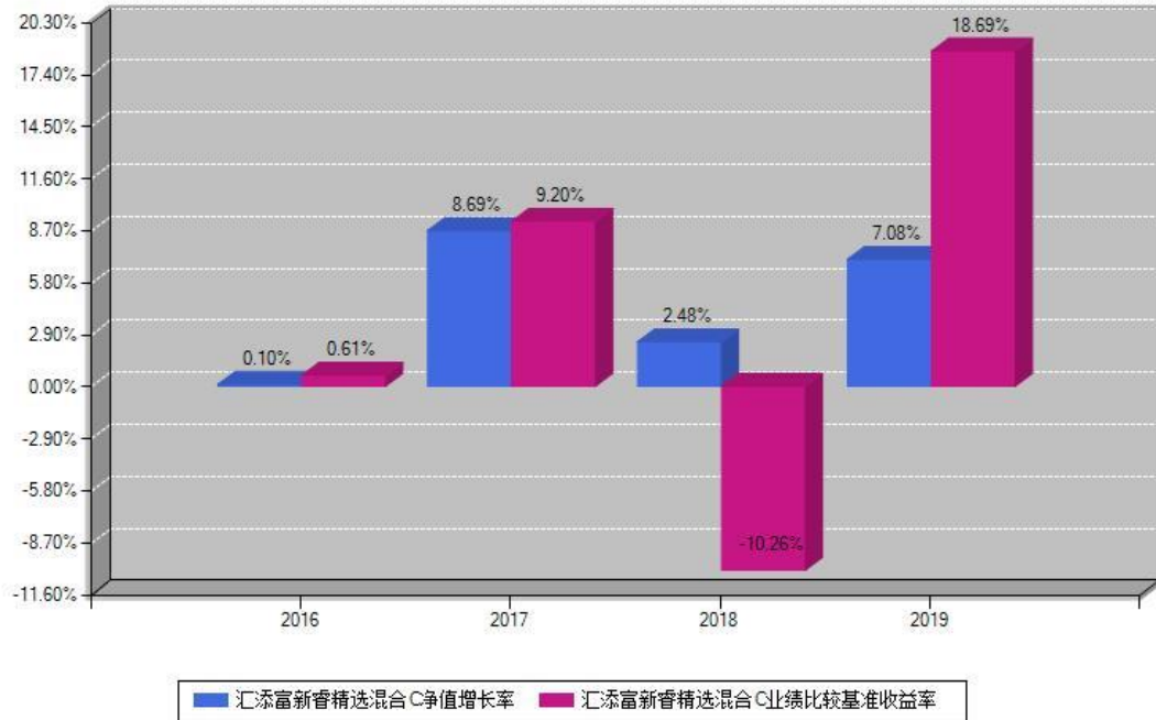
汇添富新睿精选混合C每年净值增长率与同期业绩基准收益率对比图

注：基金的过往业绩不代表未来表现。本《基金合同》生效之日为2016年12月21日，合同生效当年按实际存续期计算，不按整个自然年度进行折算。