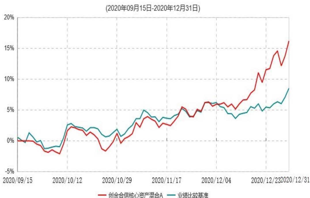
创金合信核心资产混合A累计净值增长率与业绩比较基准收益率历史走势对比图