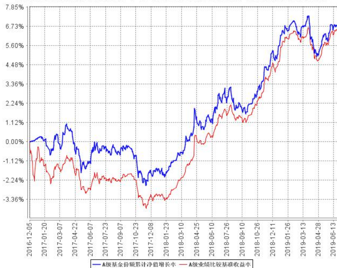
A级基金份额累计净值增长率与同期业绩比较基准收益率的历史走势对比图