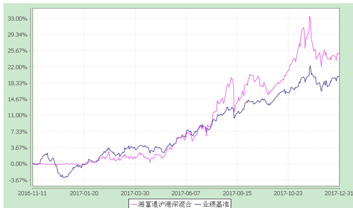
海富通沪港深灵活配置混合型证券投资基金 份额累计净值增长率与业绩比较基准收益率的历史走势对比图 (2016 年 11 月 11 日至 2017 年 12 月 31 日)

注：本基金合同于 2016 年 11 月 11 日生效。按基金合同规定，本基金自基金合同生效