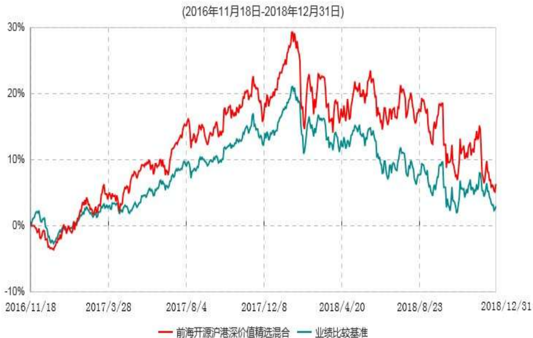
前海开源沪港深价值精选灵活配置混合型证券投资基金累计净值增长率与业绩比较基准收益率历史走势对比图