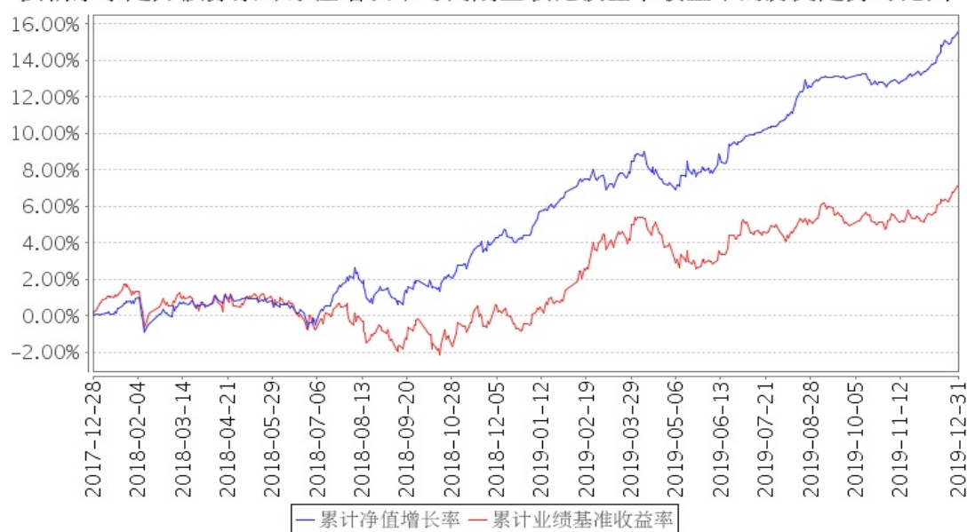
安信永泰定开债券累计净值增长率与同期业绩比较基准收益率的历史走势对比图