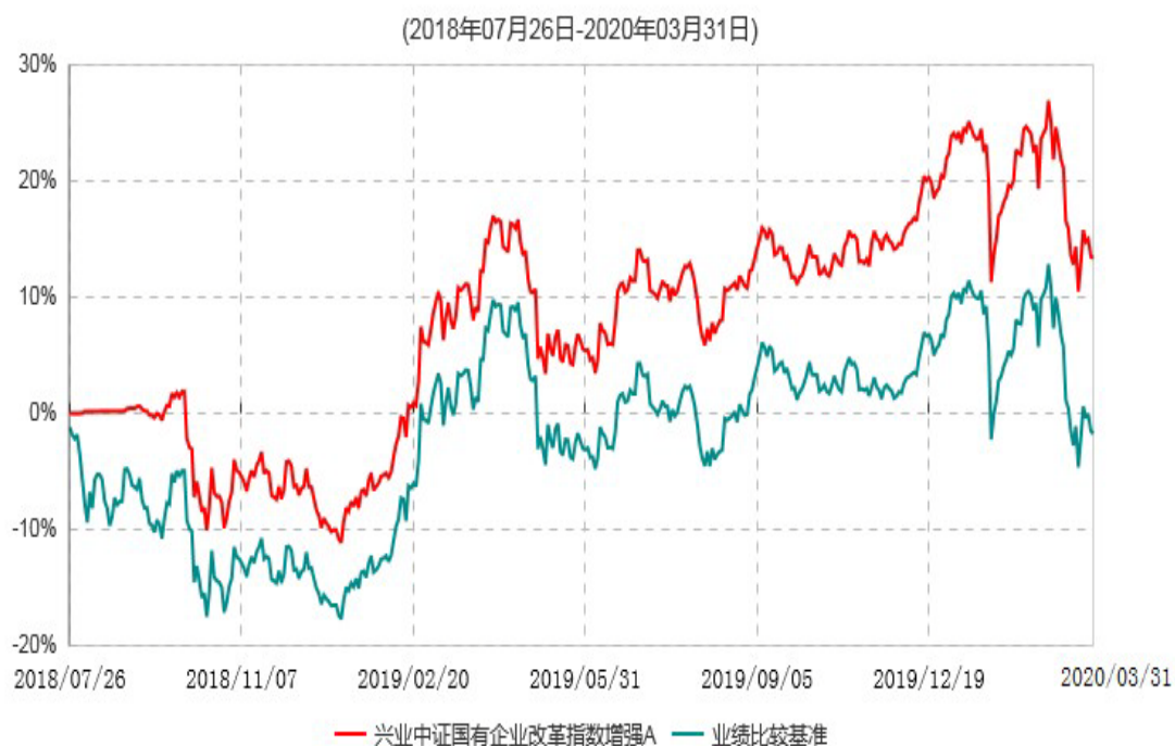
兴业中证国有企业改革指数增强A累计净值增长率与业绩比较基准收益率历史走势对比图