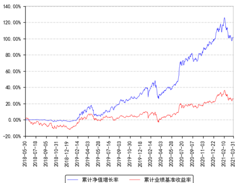
南方君信灵活配置混合A累计净值增长率与同期业绩比较基准收益率的历史走势对比图