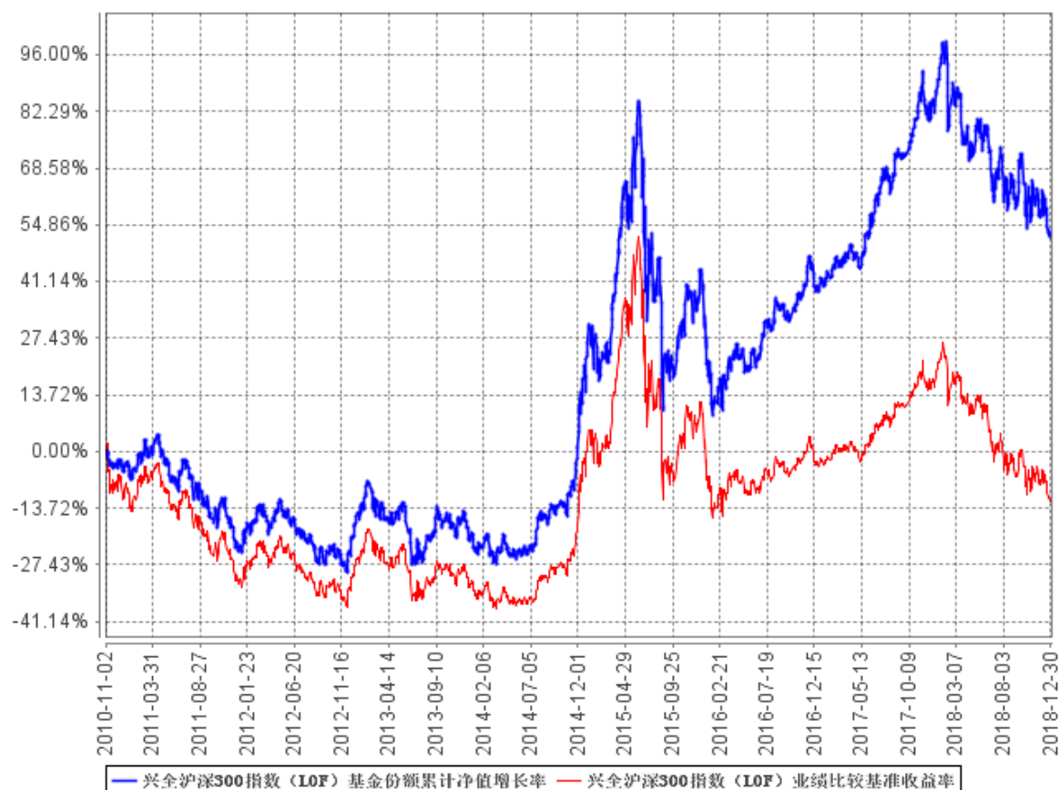
兴全沪深300指数 (LOF) 基金份额累计净值增长率与同期业绩比较基准收益率的历史走势对比图