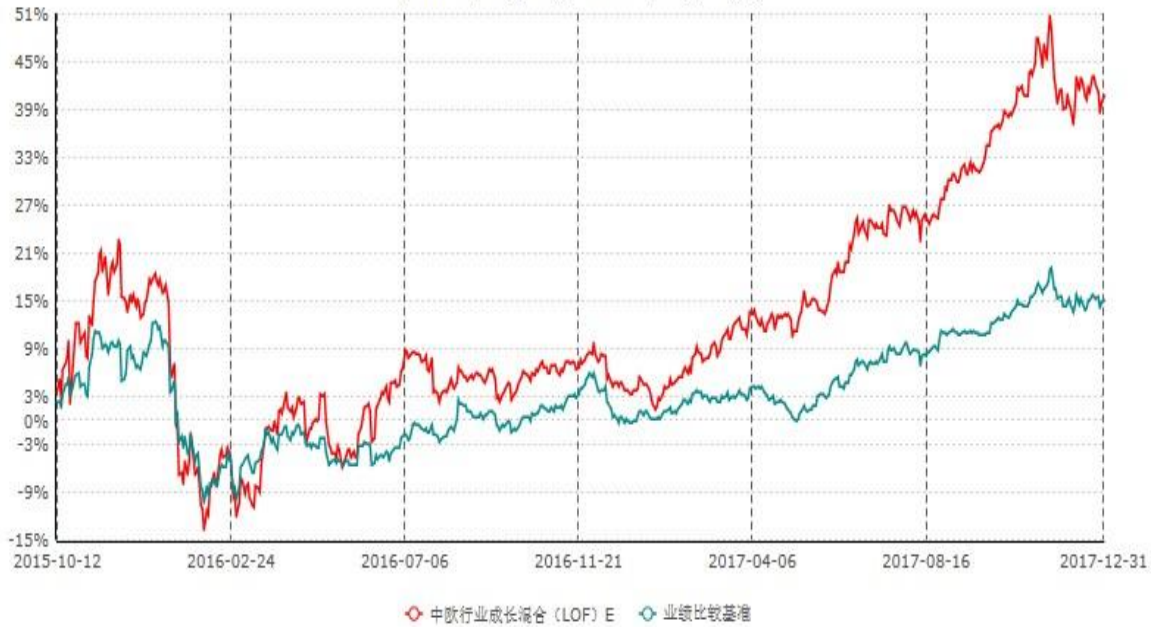
中欧行业成长混合(LOF) E累计净值增长率与业绩比较基准收益率历史走势对比图 (2015年10月12日-2017年12月31日)

注：本基金于2015年10月8日新增E份额，图示日期为2015年10月12日至2017年12月31日。