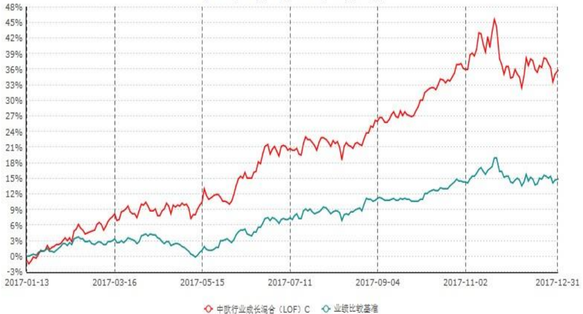
中欧行业成长混合(LOF) C累计净值增长率与业绩比较基准收益率历史走势对比图 (2017年01月13日-2017年12月31日)

注：本基金于2017年01月12日新增C份额，图示日期为2017年01月13日至2017年12月31日。