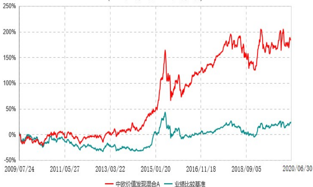
中欧价值发现混合E累计净值增长率与业绩比较基准收益率历史走势对比图