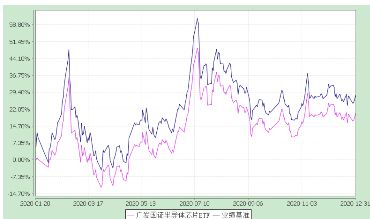
广发国证半导体芯片交易型开放式指数证券投资基金 份额累计净值增长率与业绩比较基准收益率的历史走势对比图 (2020 年 1 月 20 日至 2020 年 12 月 31 日)

注：（1）本基金合同生效日期为 2020 年 1 月 20 日，至披露时点未满一年。