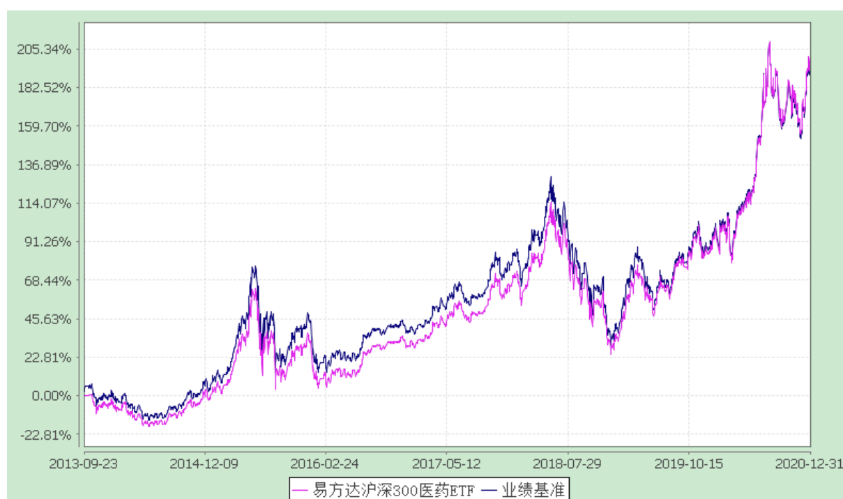
易方达沪深 300 医药卫生交易型开放式指数证券投资基金 份额累计净值增长率与业绩比较基准收益率历史走势对比图 （2013 年 9 月 23 日至 2020 年 12 月 31 日）

注：自基金合同生效至报告期末，基金份额净值增长率为 200.47%，同期业绩比较基准收益率为 198.24%。