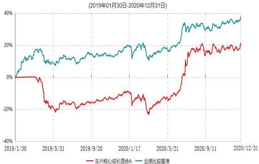
东兴核心成长混合A累计净值增长率与业绩比较基准收益率历史走势对比图