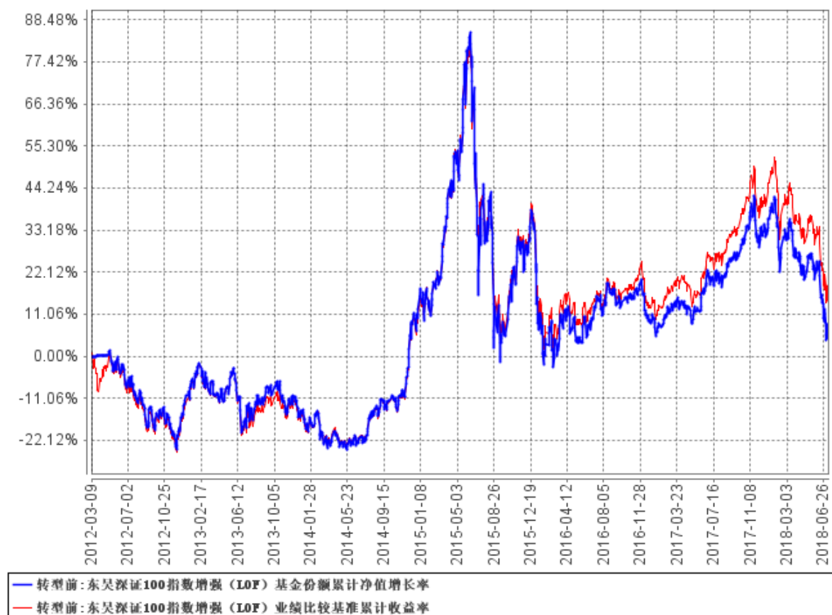
东吴深证100指数增强（LOF）基金份额累计净值增长率与同期业绩比较基准收益率的历史走势对比图

注：基金业绩比较基准=95%×深证 100 价格指数收益率+5%×商业银行活期存款利率（税后）。