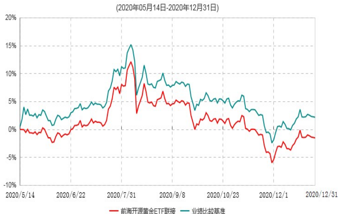
前海开源黄金交易型开放式证券投资基金联接基金累计净值增长率与业绩比较基准收益率历史走势对比图

注：①本基金的基金合同于2020年5月14日生效，截至2020年12月31日止，本基金成立未满1年。