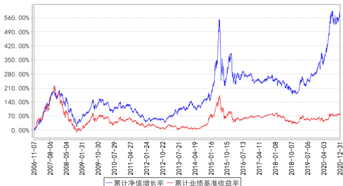
华宝先进成长混合累计净值增长率与同期业绩比较基准收益率的历史走势对比图

注：按照基金合同的约定，自基金成立日期的 6 个月内达到规定的资产组合，截至 2007 年 5 月 7 日，本基金已达到合同规定的资产配置比例。