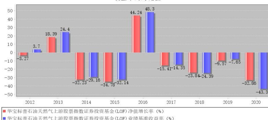
华宝标普石油天然气上游股票指数证券投资基金(LOF)每年净值增长率与同期业绩比较基准收益率的对比图