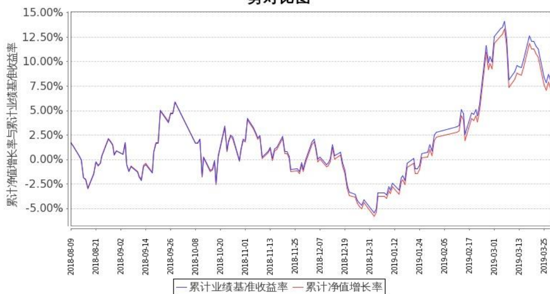
图 2：嘉实基本面 50 指数（LOF）C 基金份额累计净值增长率与同期业绩比较基准收益率的历史走势对比图