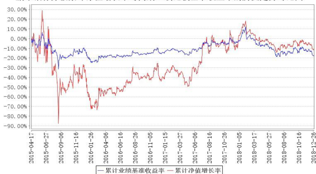
鹏华银行分级累计净值增长率与同期业绩比较基准收益率的历史走势对比图