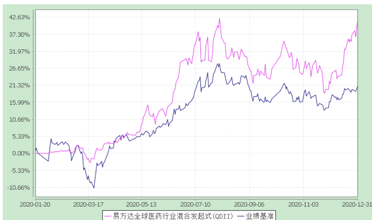
易方达全球医药行业混合型发起式证券投资基金 份额累计净值增长率与业绩比较基准收益率历史走势对比图 (2020 年 1 月 20 日至 2020 年 12 月 31 日)