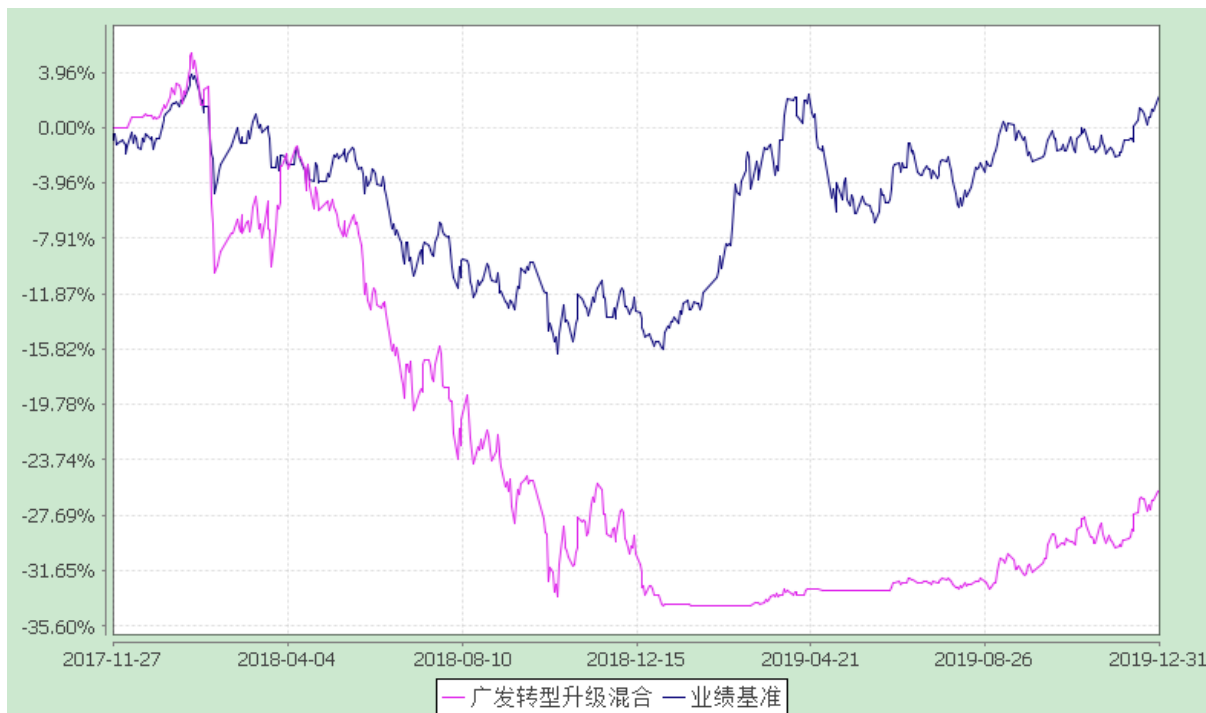
广发转型升级灵活配置混合型证券投资基金 份额累计净值增长率与业绩比较基准收益率的历史走势对比图 (2017 年 11 月 27 日至 2019 年 12 月 31 日)