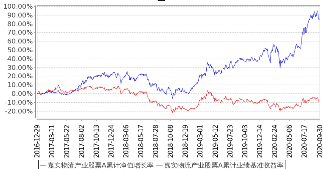
图 1：嘉实物流产业股票 A 基金份额累计净值增长率与同期业绩比较基准收益率的历史走势对比