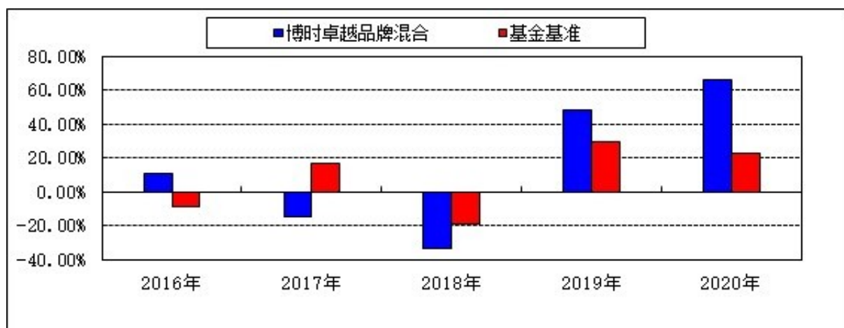
过去五年基金净值增长率与业绩比较基准收益率的对比图