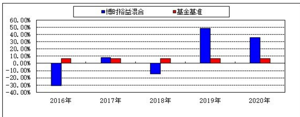
过去五年基金净值增长率与业绩比较基准收益率的对比图